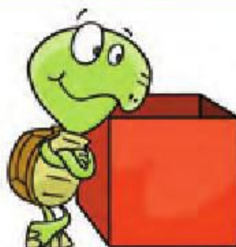
à côté de